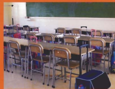
- Visita alle famiglie - Una della classi "arredate" dalla nostra Associazione