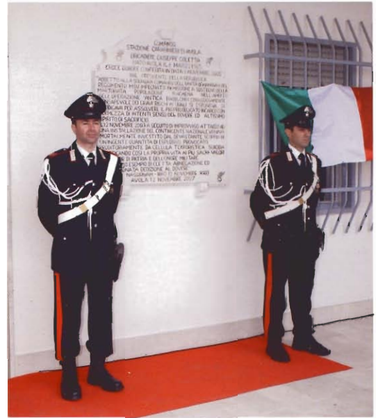
Il testo della targa commemorativa: